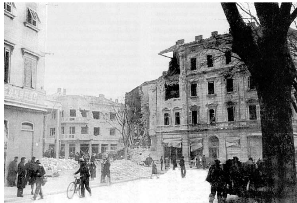
U ratnom razaranju Pule bombe su zgradu ljekarne teško oštetile, a obje susjedne kuće potpuno uništile.

Dana 9. siječnja 1944. vedro je zimsko nebo obradovalo Puljane. Riječani su pak negodovali zbog gustih oblaka nad gradom. A ne bi, da su znali kako su iz baze u Apuliji saveznički bombarderi poletjeli prema njihovom gradu s nakanom da na nj istresu svoj razarajući teret. Po dolasku nad Rijeku piloti nisu, zbog oblaka, mogli vidjeti ciljeve pa su promijenili kurs prema alternativnom cilju – osunčanoj Puli. Njihove su bombe padale svukud po gradu, neke su pogodile ciljane lučka i industrijska postrojenja, no većina je pala na domove nevinog civilnog puka u najgušće nastanjenim kvartovima. Pa i na Giardinima. Velika zgrada s glavnom ljekarnom teško je oštećena, dok je šteta na objema susjednim kućama bila totalna. Fatalne su udarce zadobile i kuće na suprotnoj strani Giardina, duž Uspona sv. Stjepana: srušene su tri stambene trokatnice (pravim čudom ostala je nedirnuta njihova prva susjeda, netom izgrađena zgrada dječjih jaslica). Nakon prvog, najsilovitijeg od svih, uslijedilo je