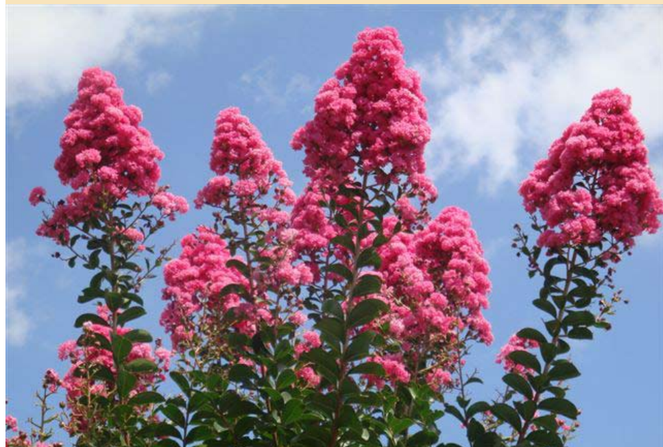
Lagerstremija (indijski jorgovan) bit će ures svakog vrta u ljetnim mjesecima

Stabla su dio biljnog carstva koja gotovo uvijek dominiraju nekim prostorom. Ako primjerice imamo impozantan primjerak stabla na travnjaku, gotovo da nam za savršen dojam ništa drugo i ne treba. No da bismo bili ponosni vlasnici jednoga ovakvog primjeka, moramo se oboruzati strpljenjem, jer svoju konačnu veličinu i ljepotu mnoge vrste dostižu tek nakon 15-20 pa i više godina. To je često razlog što se prilikom sadnje stabala prave kardinalne greške pa upravo onda kada se biljka razvije do svoga maksimuma i kada je najljepša, moramo je ukloniti jer preraste prostor na kojem smo ju posadili. Kako bismo to izbjegli, moramo se od početka voditi nekim smjernicama.