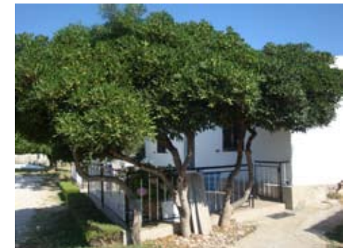
Tobirovac uzgojen kao stabalce vrlo je otporan i zanimljivog oblika

Kada se odlučujemo na sadnju stabla, prilikom izbora vrste moramo voditi računa osim o površini također i o tome koja će biti uloga stabla. Da li je to površina sa nekom namjenom (rekreacijska, za odmor i sl.), da li služi u 'izložbene' svrhe ili ima zaštitnu ulogu od buke, prašine, vjetra... pa ovisno o tome treba pristupiti odabiru vrste. Sadnja može biti pojedinačna, tj. sadimo jedno, soliterno stablo, i tada uglavnom odabiremo već odrasli primjerak i vrstu koja će se svojim