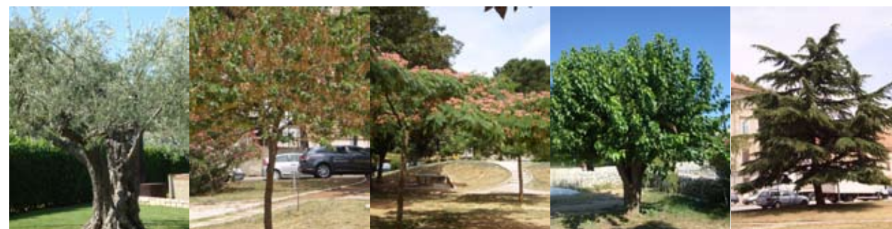
Dolje s lijeva: ulika, judino drvo, abicija, murva i cedar

karakteristikama tu dobro uklopiti i prilagoditi postojećim uvjetima. Moramo biti sigurni da se na mjestu planirane sadnje ne nalaze instalacije infrastrukture (kablovi, cijevi i dr.) koje bi nam mogle poremetiti sadnju i uzrokovati naknadne probleme. Osim ugodne sjene koju stabla pružaju, kao i zaštitne uloge koju imaju, velik broj vrsta ima i dekorativan cvat pa su oku ugodni i s tog aspekta. Zasigurno je na okućnicama poželjno prisutnost stabala koja cvatu i uz to i mirišu.