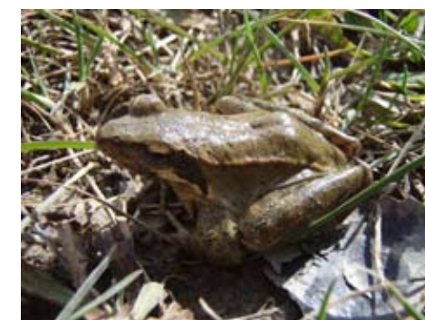
Talijanska ili lombardijska smeđa žaba

žutog mukača (lat. Bombina variegata ). Žuti mukač spada u manje žabe i lako je prepoznatljiv po svojem žarko obojanom