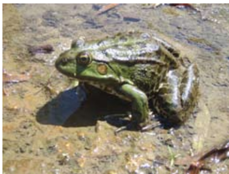
Velika zelena žaba

Sunce polako zalazi i još jedna proljetna večer je na izmaku. Dok se zadnje zrake sunca skrivaju iza brijega, stado krava dolazi na lokvu po zadnju okrpju za taj dan. Tišinu večeri prekida jedino kreket žaba. Razne melodije slivaju se iz lokve i obližnjeg grmlja. Kreket je na trenutke tako intenzivan da se osim njega ne može čuti niti jedan drugi zvuk. Dok krave prilaze lokvi, svojim kopitima utabavaju zemlju oko lokve te na taj način nesvjesno osiguravajući da lokva ostane na životu još neko vrijeme,