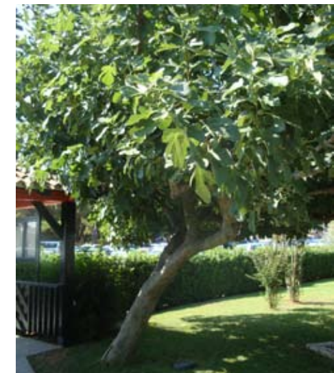
Smokva će u našem podneblju osim hlada dati i ukusne plodove

karakteristikama tu dobro uklopiti i prilagoditi postojećim uvjetima. Moramo biti sigurni da se na mjestu planirane sadnje ne nalaze instalacije infrastrukture (kablovi, cijevi i dr.) koje bi nam mogle poremetiti sadnju i uzrokovati naknadne probleme. Osim ugodne sjene koju stabla pružaju, kao i zaštitne uloge koju imaju, velik broj vrsta ima i dekorativan cvat pa su oku ugodni i s tog aspekta. Zasigurno je na okućnicama poželjno prisutnost stabala koja cvatu i uz to i mirišu.