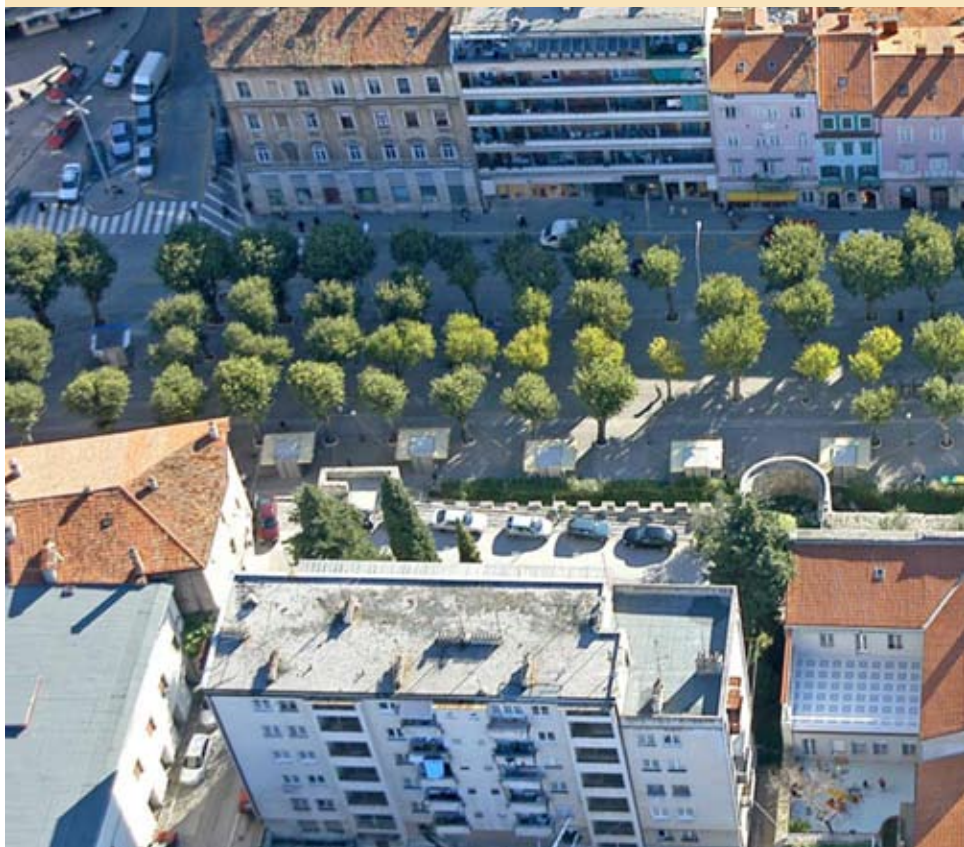
Središnji dio Giardina: raznolikost u graditeljskim stilovima ne narušava, već obogaćuje vizuru grada

Pulski Giardini u Drugom svjetskom ratu i nakon njega*